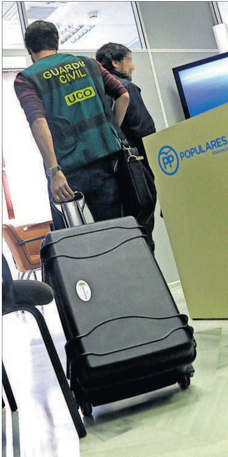
Registro de los despachos del PP en el Ayuntamiento de Valencia.