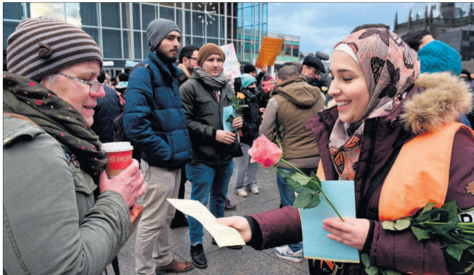
FLORES CONTRA LAS AGRESIONES EN LA ESTACIÓN DE COLONIA. Refugiados sirios distribuyeron ayer flores en la ciudad alemana de Colonia para mostrar su rechazo a los cientos de ataques sexuales perpetrados por hombres árabes y norteafricanos durante la Nochevieja. Los sucesos han desencadenado ataques xenófobos y creado una crisis política al Gobierno de Angela Merkel.