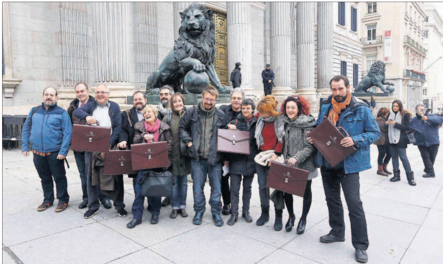
Los representantes de En Comú Podem posan en el Congreso tras recoger ayer sus actas de diputado.