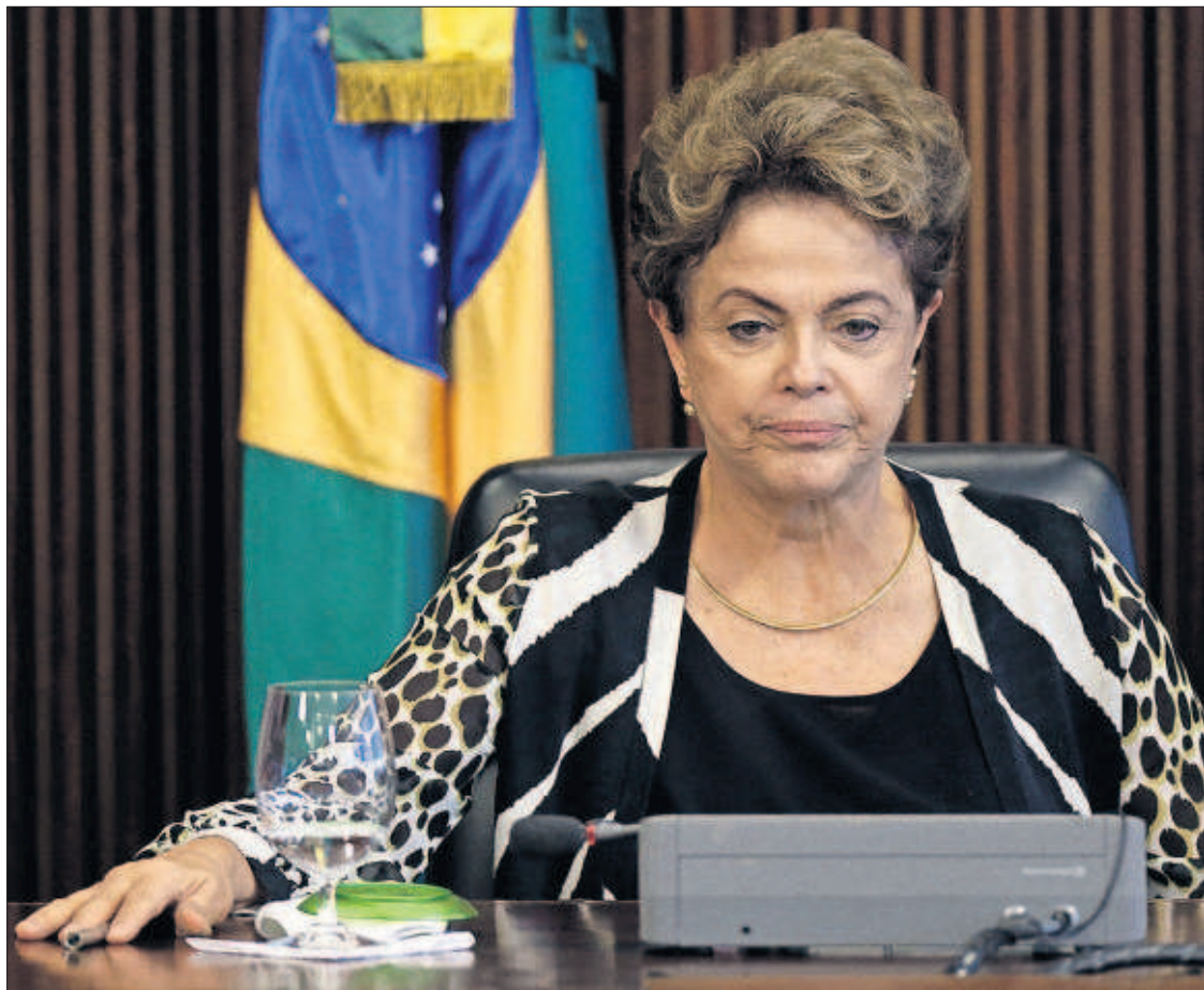
Dilma Rousseff, ayer en una reunión con sus ministros en Brasilia.

Misteriosa muerte de 337 ballenas en la Patagonia P9