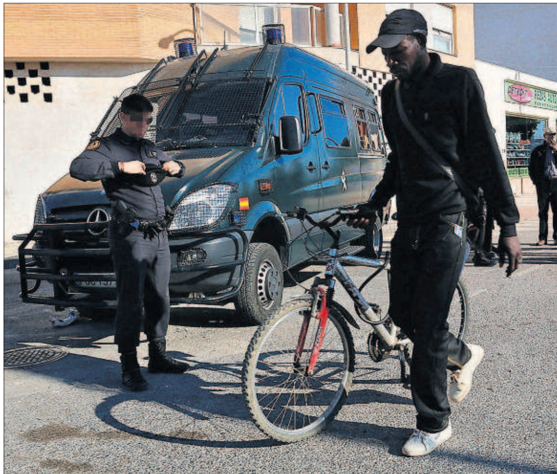
DESPLIEGUE DE LA GUARDIA CIVIL EN ROQUETAS PARA EVITAR MÁS INCIDENTES. Un centenar de guardias civiles permanecían ayer en Roquetas de Mar (Almería) para evitar nuevos incidentes tras el apuñalamiento el viernes de un hombre natural de Guinea-Bisáu.