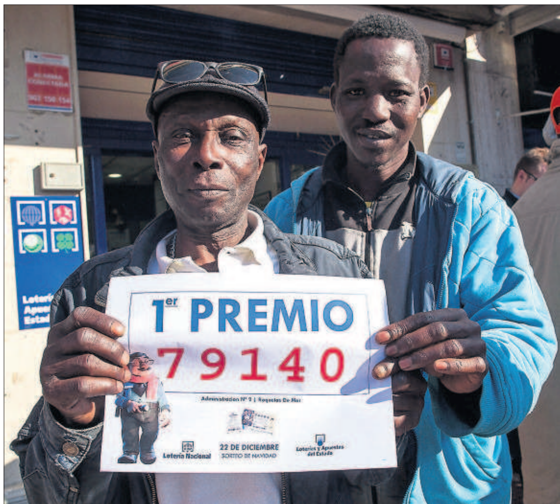
Bily, senegalés de 47 años en paro, muestra el número agraciado, del que posee un décimo.