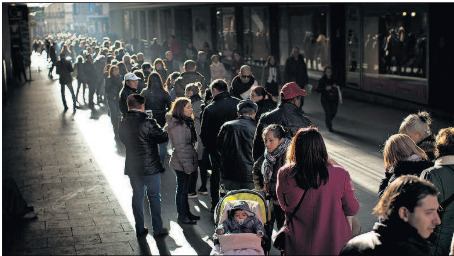
LA SUERTE ESTÁ ECHADA. Dos grandes fechas de nuestra democracia y de nuestra sociedad, las elecciones y la Lotería de Navidad, coinciden este año. Muchas de las personas que ayer formaban cola ante una administración de lotería en el centro de Madrid, lo harán hoy ante las urnas.

El 20-D en EL PAÍS A partir de las 19.00, cinco horas de TV en elpais.com