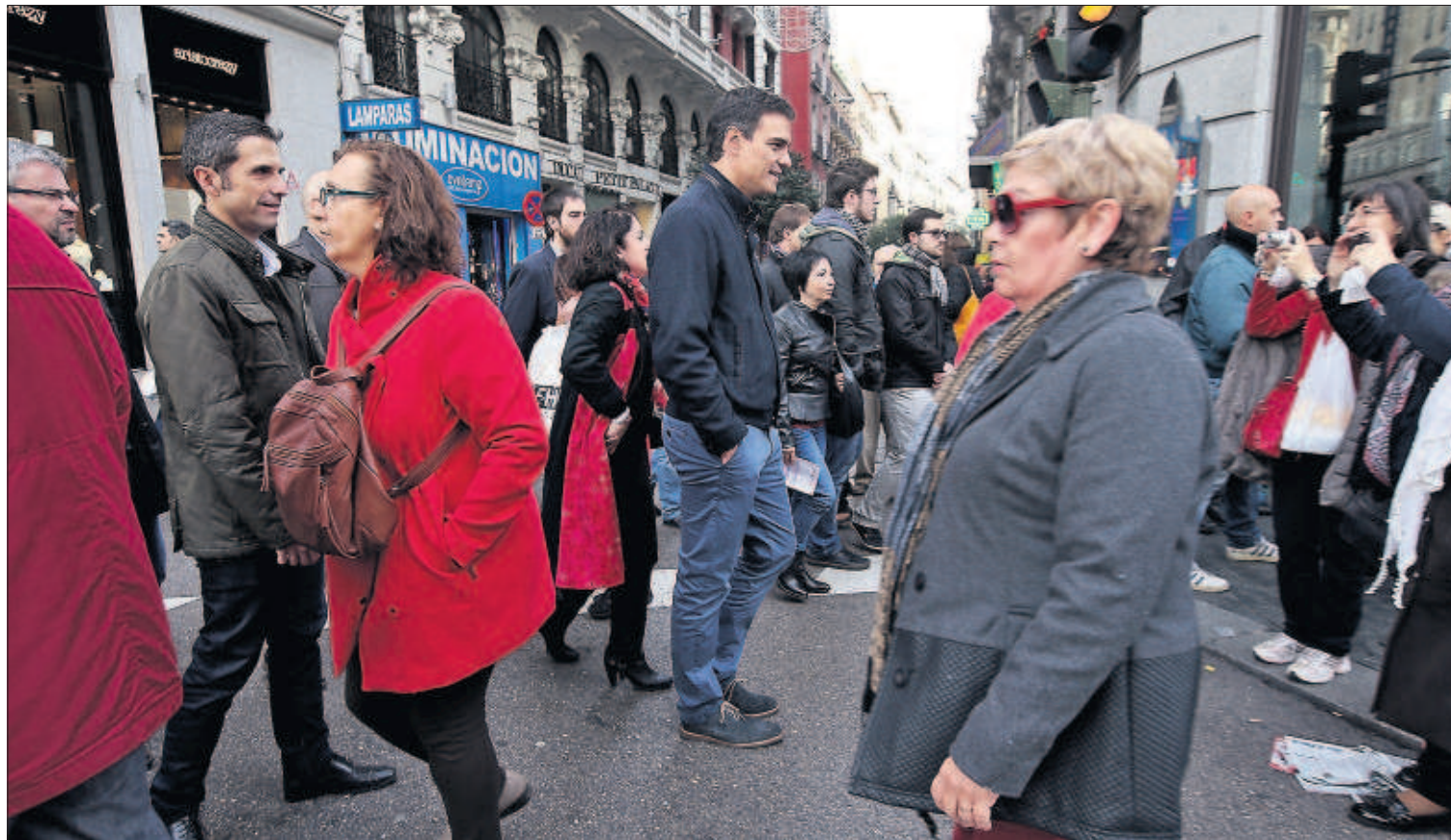
LOS CANDIDATOS MANTIENEN SUS ACTIVIDADES EN LA CALLE TRAS LA AGRESIÓN A RAJOY. El puñetazo a Mariano Rajoy en un acto electoral no ha cambiado los planes de los candidatos. Ayer, Pedro Sánchez paseó por la madrileña calle de Hortaleza. PÁGINA 22

"Es el líder absoluto de la carrera presidencial". El presidente ruso, Vladimir Putin, no escatimó ayer elogios para Donald Trump, el candidato que lidera las encuestas de las primarias en el Partido Republicano estadounidense. Tras la conferencia de prensa de balance del año, Putin afirmó que Trump es una persona "brillante y con talento". Se ofreció a colaborar con él como con "cualquier presidente por el que vote el pueblo norteamericano". PÁGINA 9