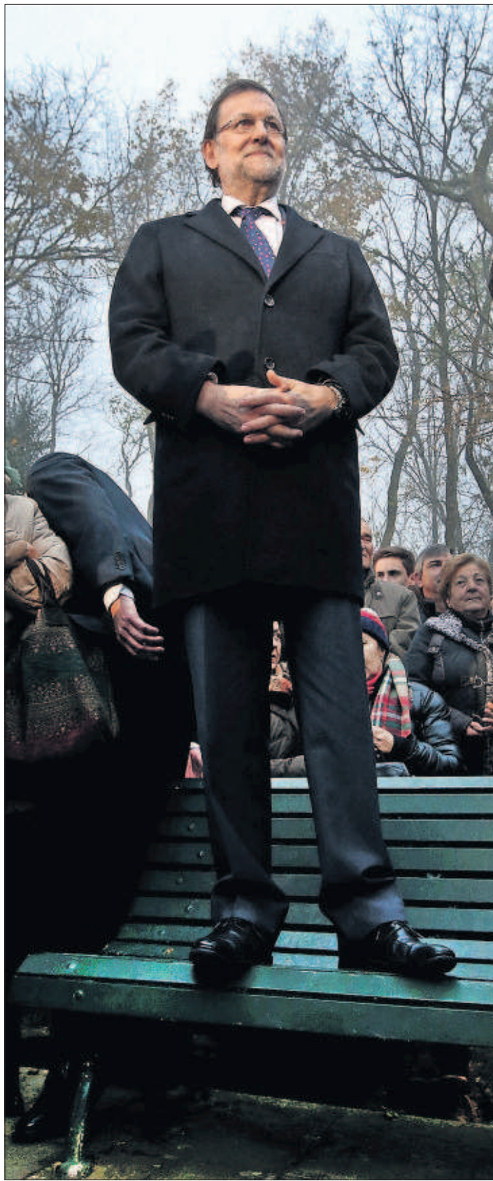
MITIN DESDE EL MISMO BANCO, NUEVE AÑOS DESPUÉS. Mariano Rajoy se subió ayer al banco del parque de Benavente donde en 2006 improvisó un mitin tras un boicot de activistas.

Un 26% dice haber seguido el debate en directo en su totalidad o en parte. Los candidatos que sí participaron, Pedro Sánchez (PSOE) y Albert Rivera (Ciudadanos), empataron, logrando una nota media de 5,8 y 5,9 sobre 10 en la encuesta. Pablo Iglesias (Podemos) logró también un aprobado con una calificación media de 5. PÁGINAS 17 A 20 EDITORIAL EN LA PÁGINA 14