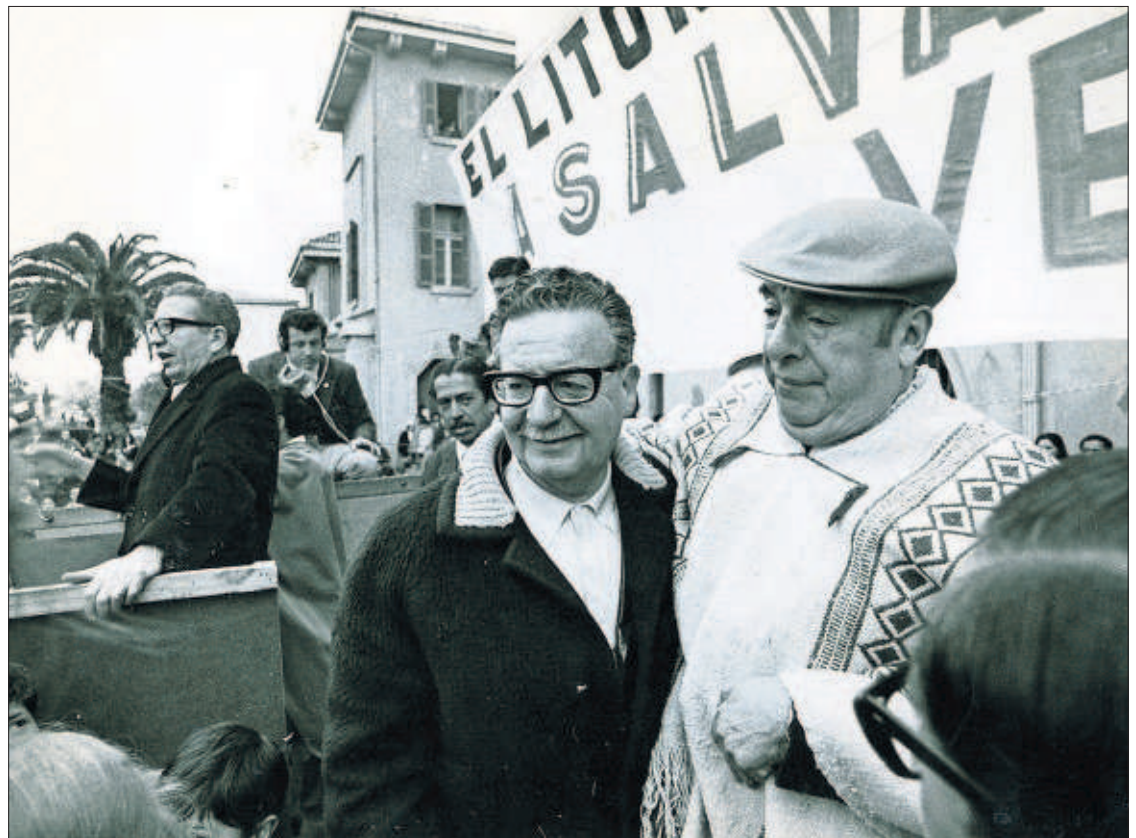
FUNDACIÓN SALVADOR ALLENDE

JAVIER CASQUEIRO, Madrid El presidente del Gobierno español, Mariano Rajoy, aceptará reformar la Constitución en la próxima legislatura. Ayer, durante la firma del acuerdo de alianza con Unión del Pueblo Navarro (UPN), dejó entrever esa intención. Rajoy aseguró que el PP votaría "a favor de la eliminación de la Disposición Transitoria Cuarta de la Constitución en el supuesto de que al final haya una reforma constitucional". Ese epígrafe prevé el mecanismo de fusión de Navarra con Euskadi y se encuentra recogido en el Estatuto de Gernika. El PP no va a incluir la reforma constitucional en su programa, pero su presidente está dispuesto a afrontarla si, como ayer constató la encuesta oficial del Centro de Investigaciones Sociológicas (CIS), su partido es el más votado. Rajoy, según fuentes cercanas a su equipo, estudiaría las propuestas del PSOE o Ciudadanos. Él mismo maneja cambios concretos como la sucesión en la Corona, la cuestión territorial o fijar el nombre de las autonomías en el texto. PÁGINAS 15 y 16