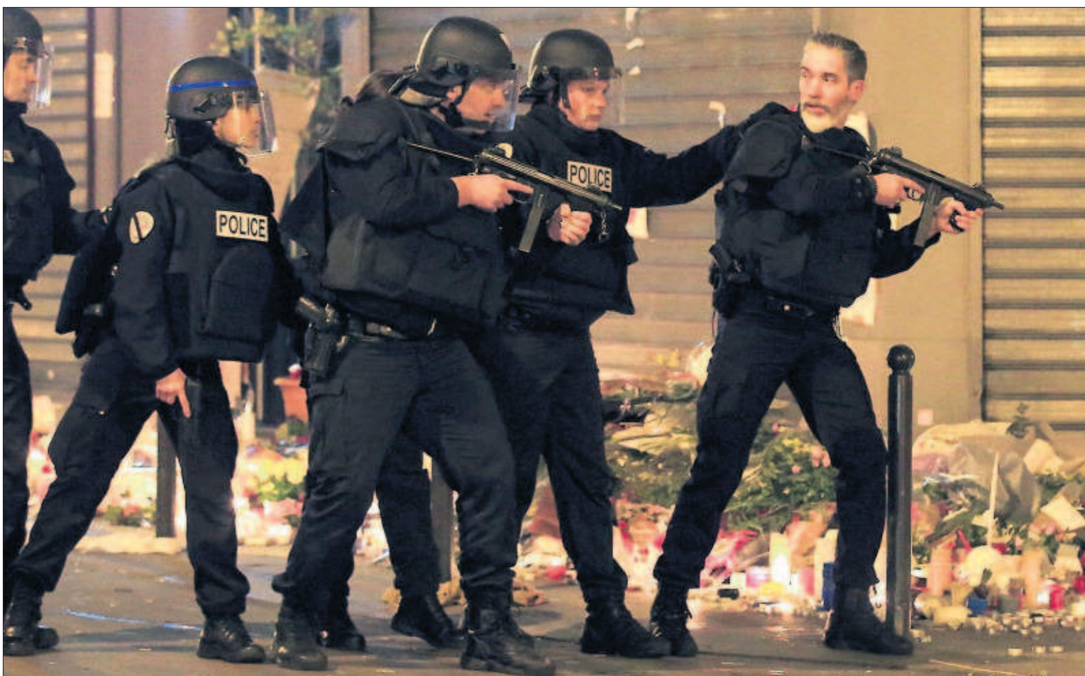
Policías franceses apostados ayer cerca de uno de los restaurantes atacados el viernes. Abajo, Salah Abdeslam, el presunto terrorista huido.

PÁGINAS 3 A 14 Y 19 Y 20 EDITORIAL EN LA PÁGINA 16