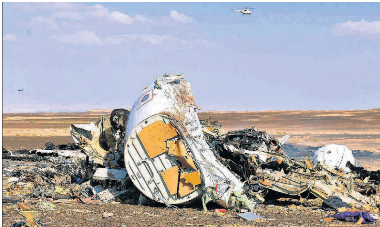
DESASTRE AÉREO EN EL SINAI. Rusia y Egipto dudan de que el avión ruso que se estrelló ayer en la península del Sinaí con 224 personas a bordo sufriera un atentado, a pesar de que yihadistas cercanos al Estado Islámico se atribuyeron el derribo (en la foto, restos del fuselaje). P5