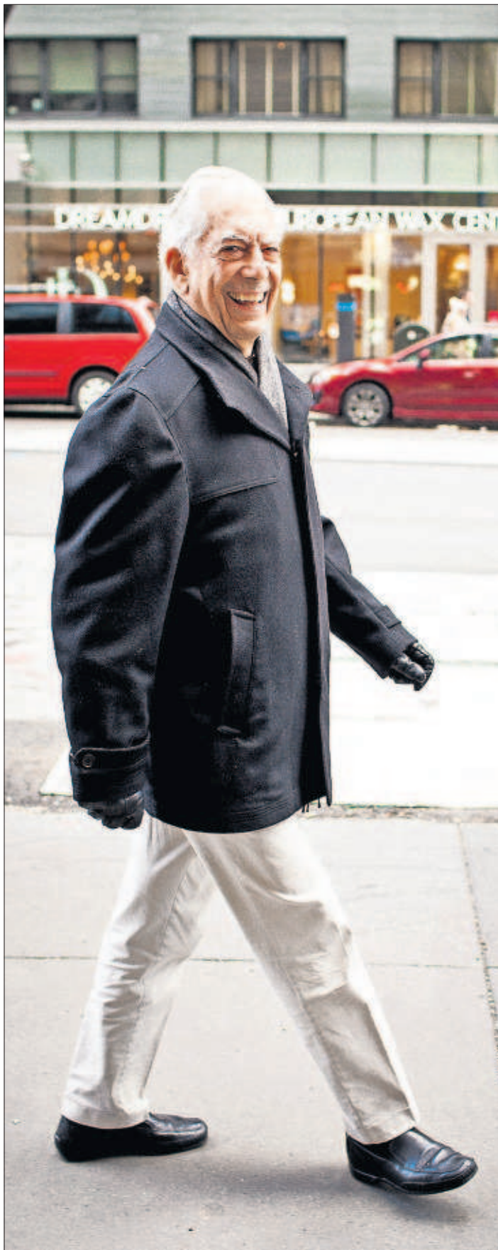
Mario Vargas Llosa, en Nueva York, hace una semana.