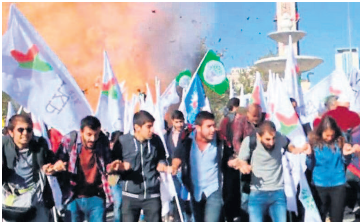
Una captura de vídeo muestra el momento de la explosión de ayer durante una manifestación a favor de la paz en Ankara, la capital de Turquía.

El tratado del Pacífico busca liderar el comercio mundial