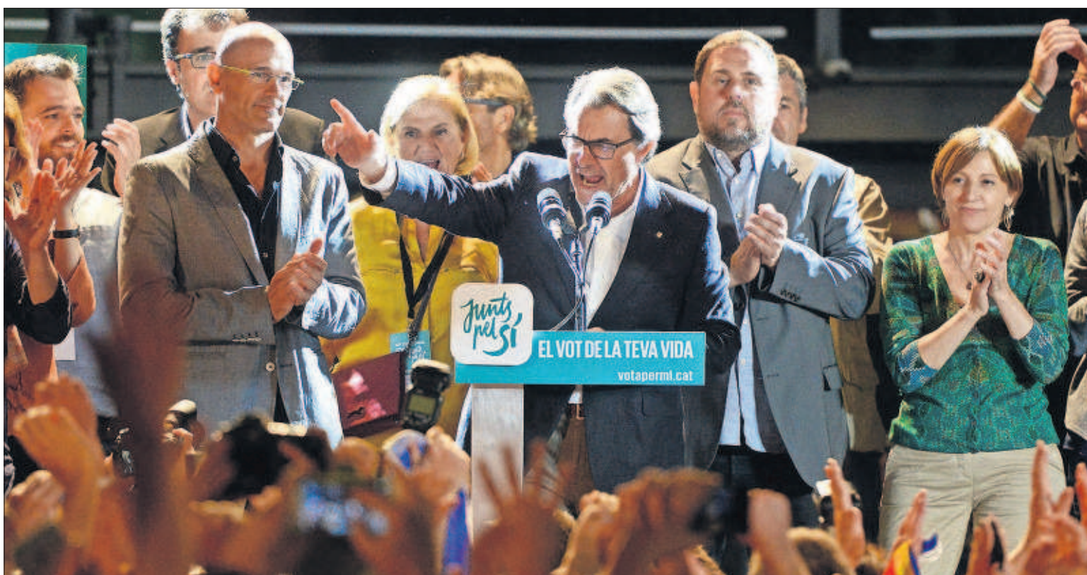
Mas, entre Romeva (izquierda) y Junqueras, se dirige a los simpatizantes de Junts pel Sí al final de la jornada electoral.