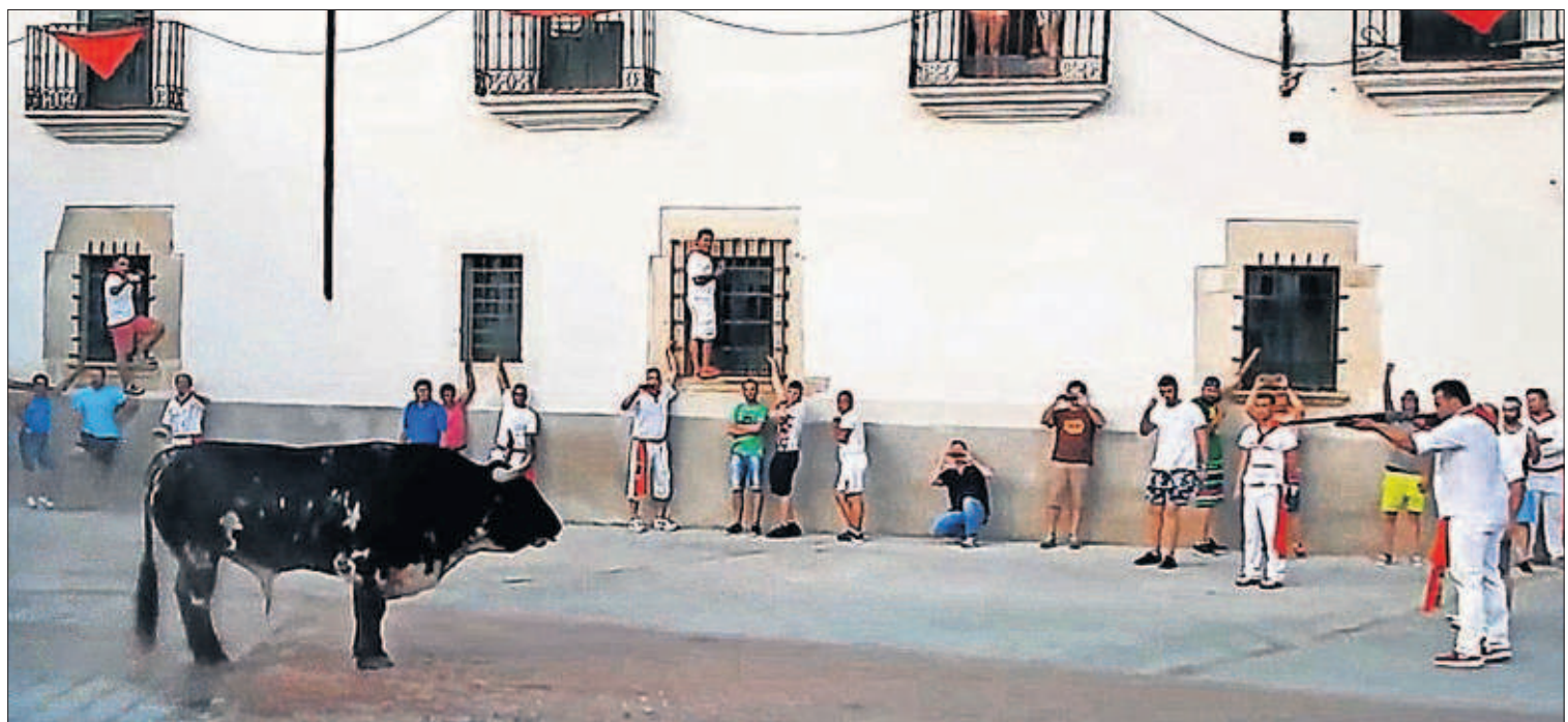
VOX ÁNIMA (YOUTUBE)

partido emergente de Pablo Iglesias. El sondeo también destaca que la aceptación del actual modelo autonómico aumenta seis puntos, hasta el 38,2%. PÁGINAS 17 Y 18