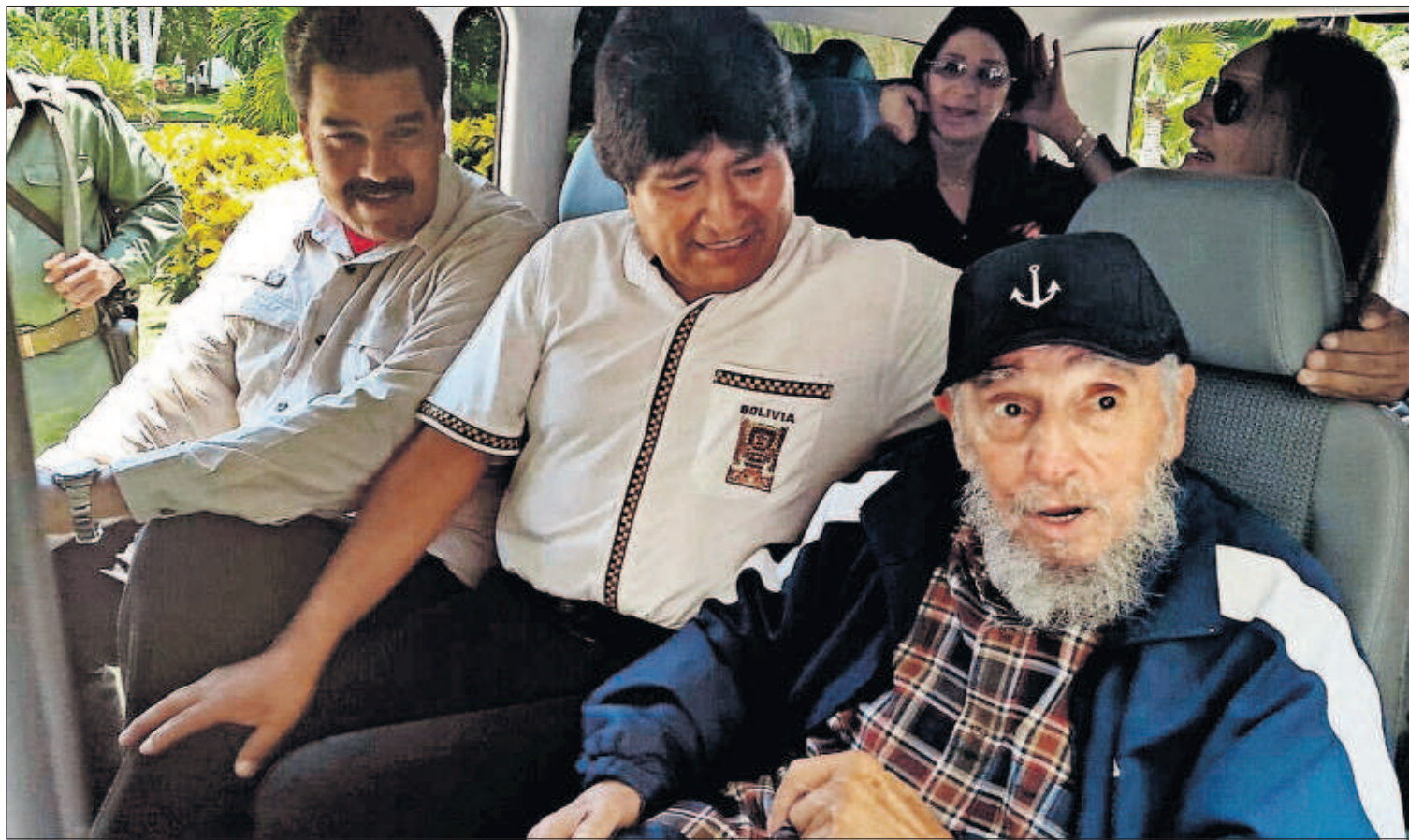
CUMPLEAÑOS EN LA HABANA. En la víspera de la histórica reapertura de la Embajada norteamericana en La Habana, los presidentes de Venezuela, Nicolás Maduro (izquierda), y Bolivia, Evo Morales, visitaron ayer al expresidente cubano Fidel Castro con motivo de la celebración de su 89º cumpleaños. Una imagen de la Agencia Boliviana de Información les muestra en una furgoneta. / REUTERS PÁGINAS 6 Y 7 / EDITORIAL EN LA PÁGINA 10

razona que “las tasas de desempleo persistentemente elevadas, la baja productividad y los niveles todavía considerables de deuda pública y privada continúan planteando desafíos de política de cara al futuro”. Por ello, pide más reformas estructurales en la economía española, sobre todo en la legislación laboral. El organismo pronostica que el desempleo en España se mantendrá en, al menos, el 15,8% durante un lustro. PÁGINA 29