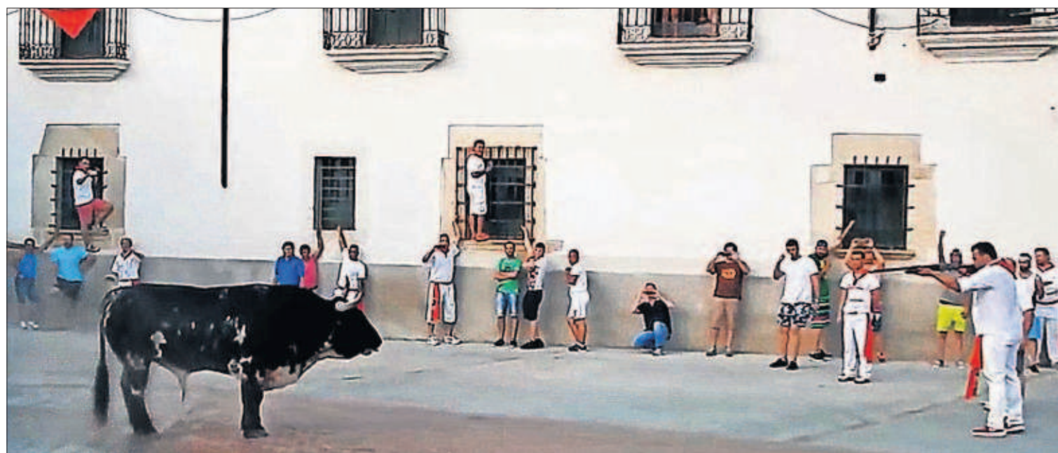
VOX ÁNIMA (YOUTUBE)