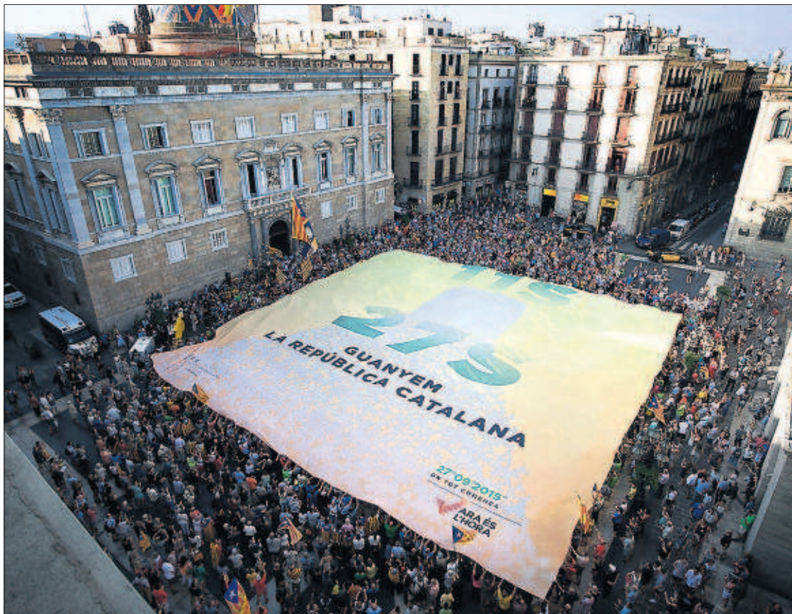
Unas 600 personas se concentraron ayer por la independencia en la plaza de Sant Jaume en Barcelona.

Las aerolíneas de EE UU prohíben el transporte de trofeos en sus aviones