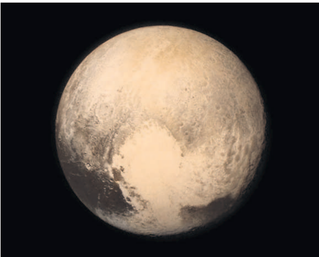
Imagen de Plutón tomada a 766.000 kilómetros de distancia por la sonda New Horizons .

DANIEL MEDIAVILLA, Madrid La nave espacial New Horizons se aproximó ayer a unos 12.500 kilómetros de Plutón, la distancia más corta a la que se ha estado jamás de ese planeta. La sonda enviará nuevas imágenes y datos más precisos de Plutón en las próximas horas. PÁGINA 26