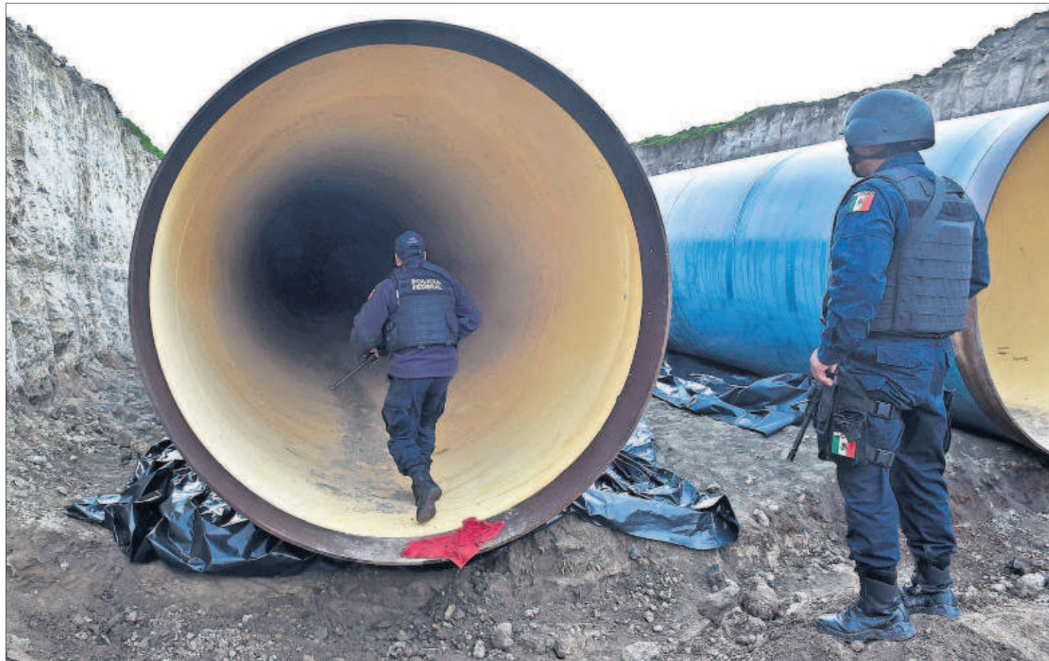
Policías mexicanos inspeccionan unas tuberías cercanas al penal de El Altiplano, del que se fugó Joaquín El Chapo Guzmán.

La espectacularidad de la evasión de El Chapo, de 58 años, que escapó por un pasadizo iluminado, ventilado y hasta con escalera, da pie a la sospecha de que recibió ayuda del interior del presidio. Todo el personal de la cárcel, hasta ahora la más segura de México, ha sido retenido y 18 funcionarios interrogados en la capital. PÁGINAS 6 A 9