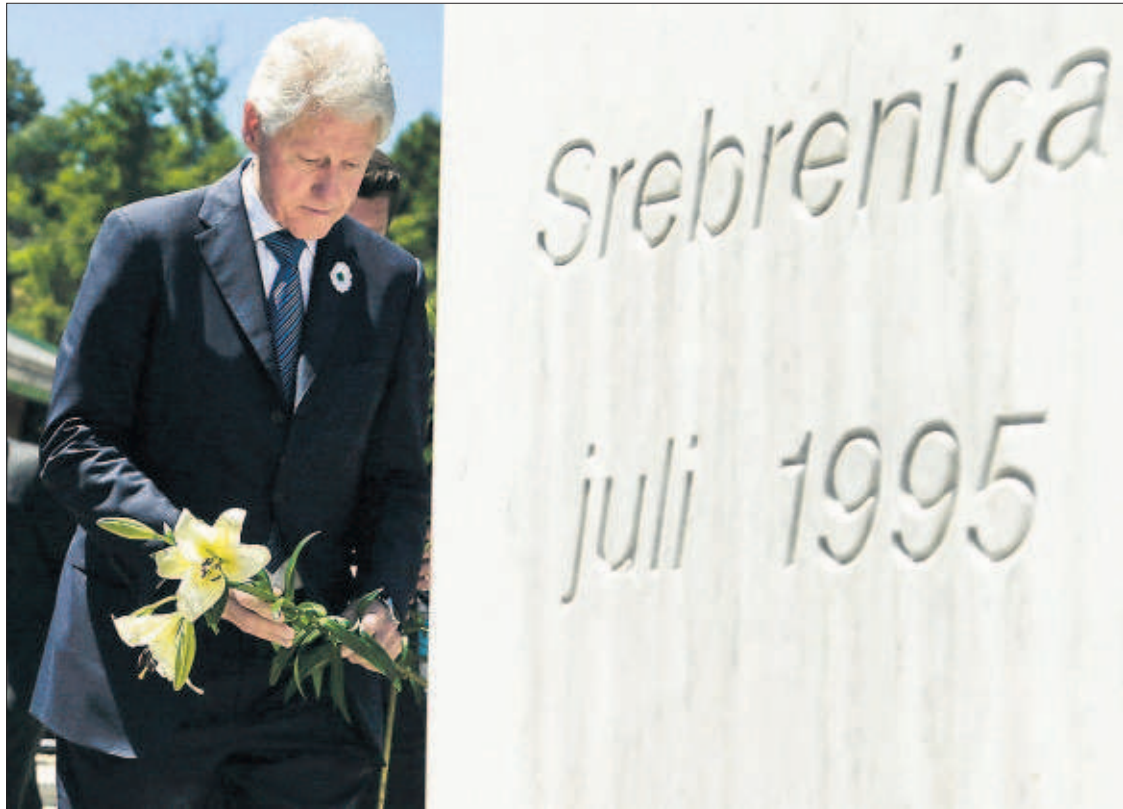
ANTONIO BRONIC (REUTERS)