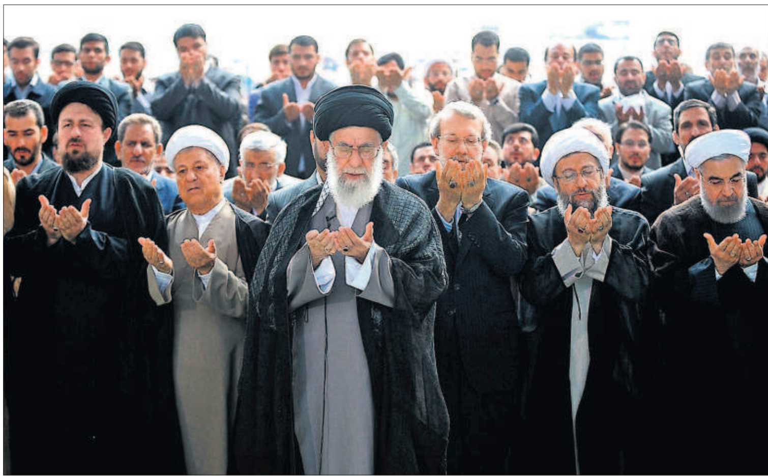
FIN DEL RAMADÁN Y NUEVA ETAPA EN ORIENTE PRÓXIMO. El líder supremo de Irán, el ayatolá Alí Jamenei, aprovechó la celebración del Eid al Fitr, el fin del ayuno, para respaldar el acuerdo nuclear con Occidente y marcar distancias con Estados Unidos. El pacto perfila un nuevo equilibrio de fuerzas en esa convulsa región. En la imagen, Jamenei (centro) reza en Teherán junto a la cúpula iraní.