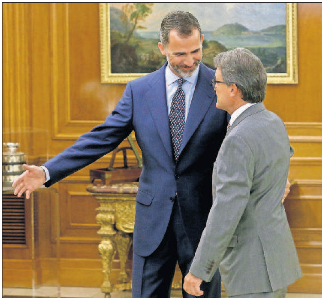
Felipe VI recibe al presidente catalán, Artur Mas, ayer en el palacio de La Zarzuela.