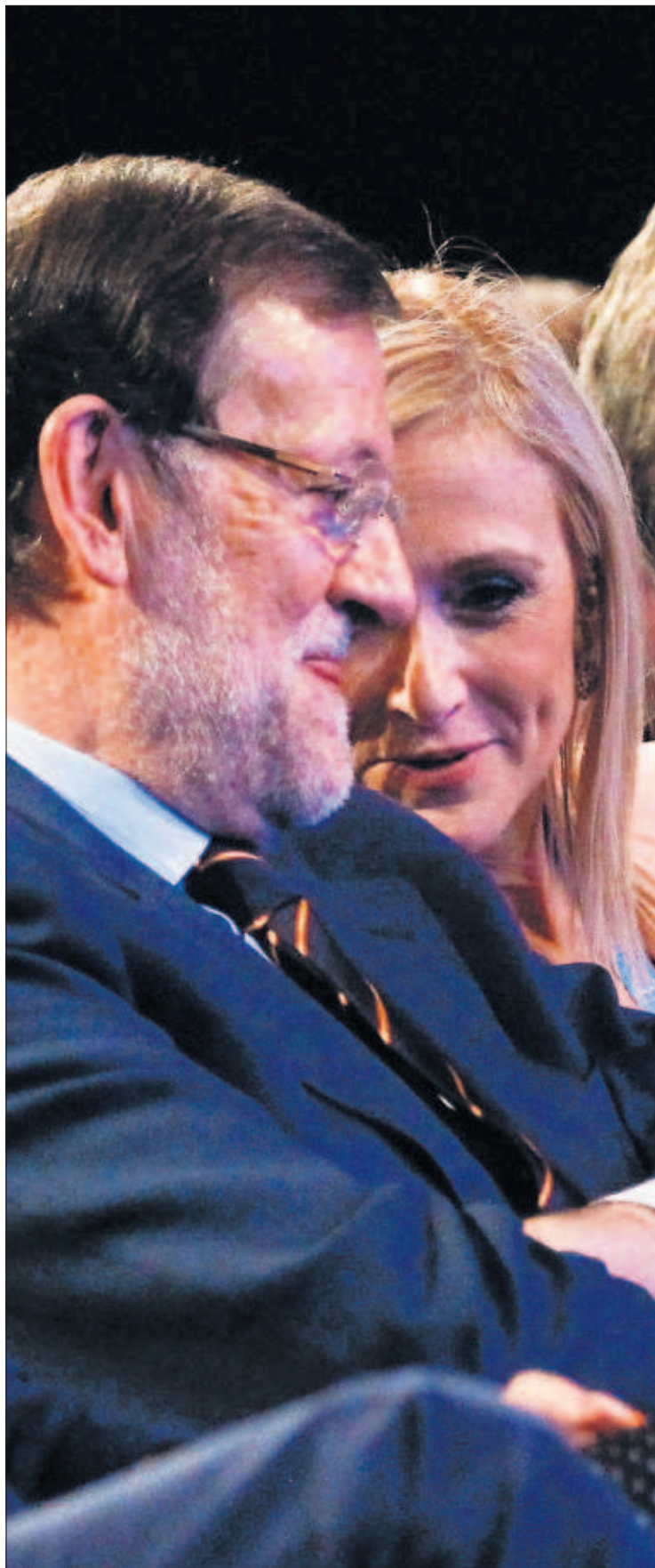
Rajoy y Cristina Cifuentes, en la Conferencia Política del PP.