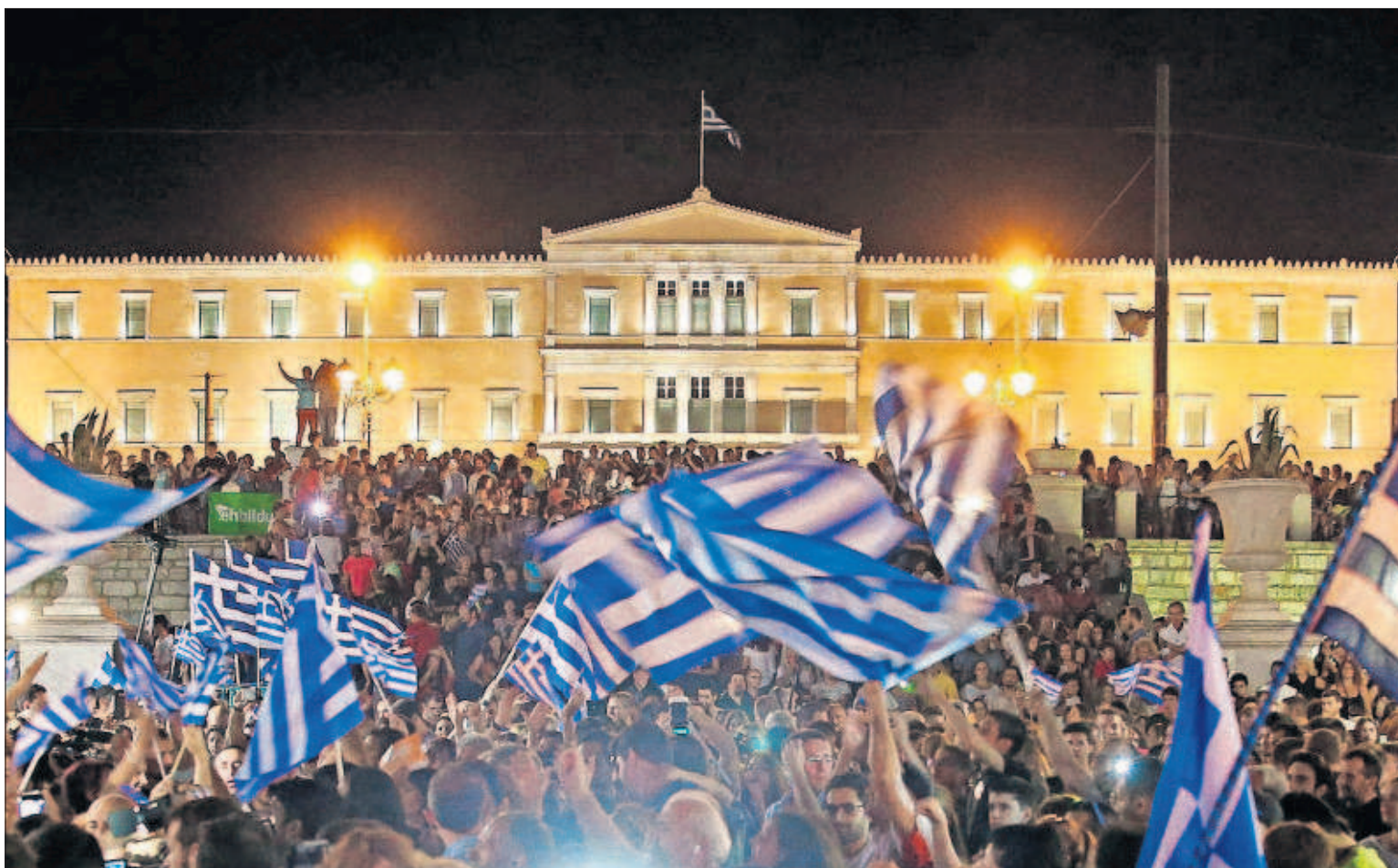
Partidarios del no celebran el resultado del referéndum ante el Parlamento de Atenas.