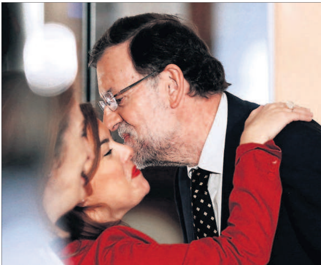
Soraya Sáenz de Santamaría saluda a Mariano Rajoy ante Ana Pastor, ayer en Madrid.

La cúpula del PSOE cree que el presidente del Gobierno, Mariano Rajoy, "no quiere adelantar las elecciones", según dicen algunos de sus dirigentes a este diario. En un encuentro en La Moncloa el mes pasado, el presidente comentó al líder socialista, Pedro Sánchez, que sopesaba esa opción. El adelanto de la rebaja del IRPF anunciado ayer se interpreta en las filas del PSOE como una muestra de desesperación ante la enorme pérdida de poder resultante de las elecciones del 24-M y como el inicio de una larga precampaña con medidas de claro calado electoralista. PÁGINA 17