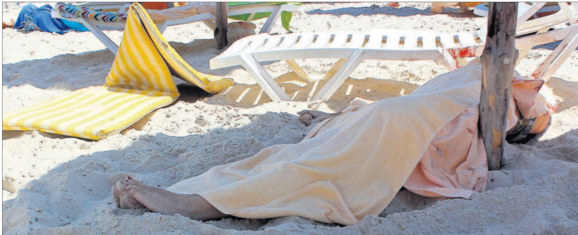
El cadáver de una de las 37 víctimas del atentado de ayer en la localidad tunecina de Susa, tapado por una toalla en la playa.