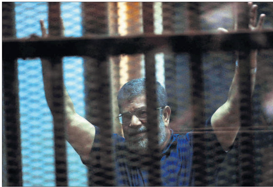
EGIPTO CONDENA A MUERTE AL ÚNICO PRESIDENTE ELEGIDO EN LAS URNAS. Un tribunal de El Cairo condenó ayer a muerte por conspiraciones y espionaje a Mohamed Morsi, el único presidente democrático en la historia del país. Al conocer el veredicto, el islamista Morsi hizo un gesto de victoria. PÁGINA 3