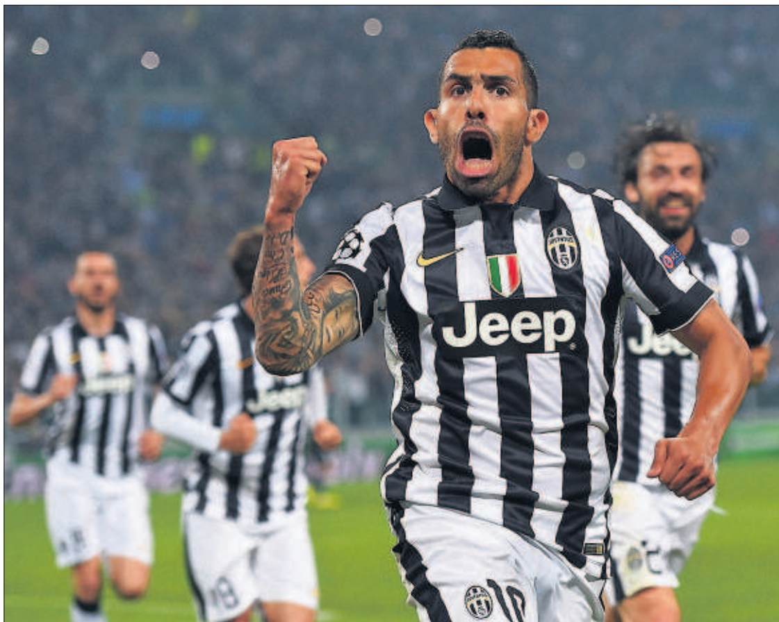
LA JUVE SOMETE AL REAL MADRID. El Real Madrid perdió ayer ante el Juventus (2-1) en la ida de las semifinales de la Champions. Marcaron Morata, Tévez (en la imagen) y Cristiano. PÁGINAS 34 Y 35

El programa lo coordinó el cofundador del partido Juan Carlos Monedero, que abandonó la formación la semana pasada después de distanciarse del sector encabezado por Íñigo Errejón. Este defiende la moderación para ocupar un mayor espectro político apelando al centro. Ayer, Iglesias no mencionó a Monedero al presentar el programa para las autonómicas. Fuentes de la dirección de Podemos dijeron a este diario que en realidad Monedero no redactó el documento en su totalidad sino que "lo coordinó". Podemos no concurre con su propia marca a las municipales, de ahí que las iniciativas sean solo para las autonómicas. PÁGINAS 12 Y 13