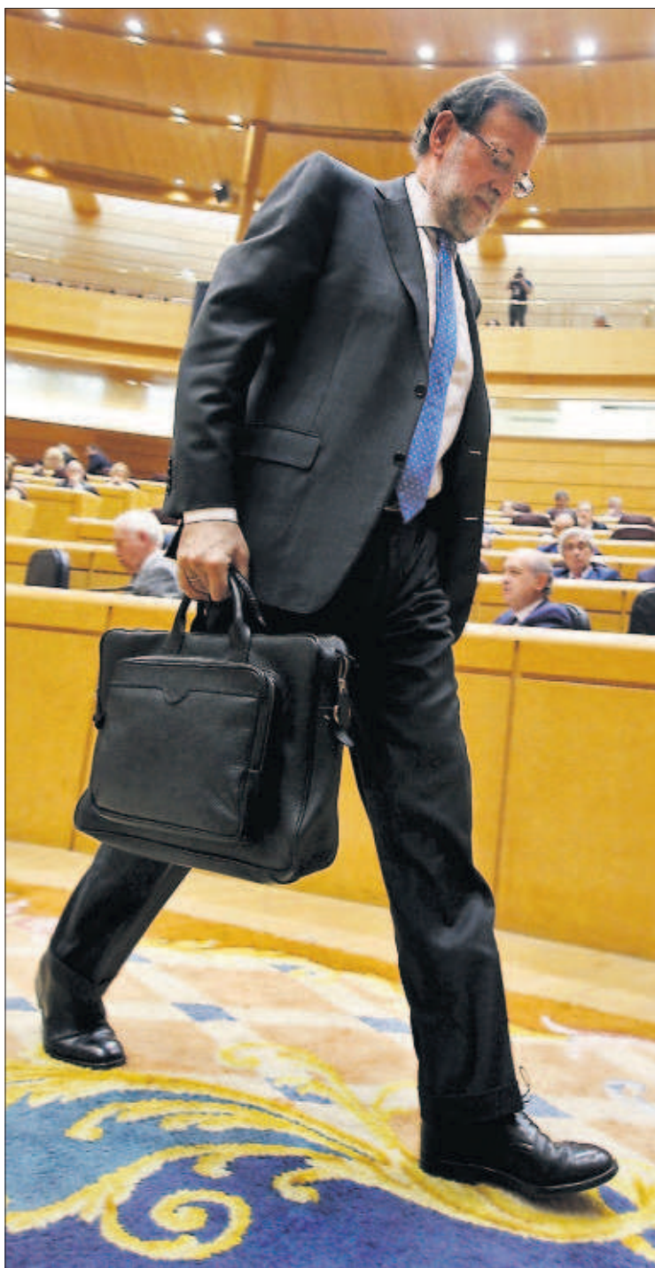
Mariano Rajoy, ayer a su llegada al pleno del Senado.