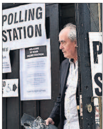
Un votante ayer en Oxford.

El actual primer ministro, el conservador David Cameron, ya ha enviado a un hombre de confianza para reeditar la actual coalición con el Partido Liberal Demócrata. La innegociable celebración de un referéndum sobre la permanencia de Reino Unido en la UE impuesta por los