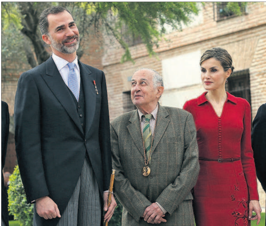
"DIGAMOS BIEN ALTO QUE PODEMOS" . Ajeno al protocolo y con un discurso reivindicativo, el escritor Juan Goytisolo recibió ayer en Alcalá de Henares el premio Cervantes de manos de los Reyes, junto a los que aparece en la imagen. El escritor proclamó: "Digamos bien alto que podemos". PÁGINAS 44 Y 45

"La decisión de Griñán hay que ponerla en relación con su dependencia del Parlamento andaluz y con la proximidad de que haya nuevos senadores por designación autonómica", sostuvo ayer Chaves en conversación con EL PAÍS. El expresidente perderá su condición de aforado y su escaño en noviembre, cuando se convoquen las elecciones generales. PÁGINAS 12 Y 13