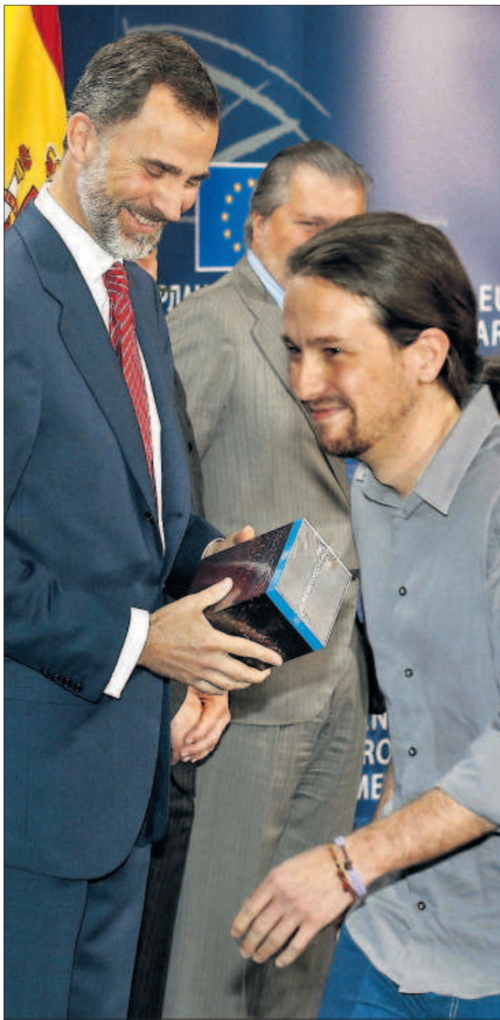
GUIÑO DE PABLO IGLESIAS AL REY. Pablo Iglesias regaló ayer a Felipe VI la serie Juego de Tronos en la visita del Rey al Parlamento Europeo, a la que faltaron al menos 15 diputados españoles de formaciones de la izquierda. / DELMI ÁLVAREZ PÁGINA 14 / EDITORIAL EN LA PÁGINA 26

Los posibles fichajes han descartado por ahora esa posibilidad, pero los barones del PP quieren mantener esa puerta abierta, en comunidades como la valenciana, Baleares, Extremadura, Madrid o Murcia, ante los más que previsible malos resultados electorales, que les llevarían a perder el gobierno que ahora disfrutan en esas autonomías, en casi todas ellas con mayoría absoluta. PÁGINA 8