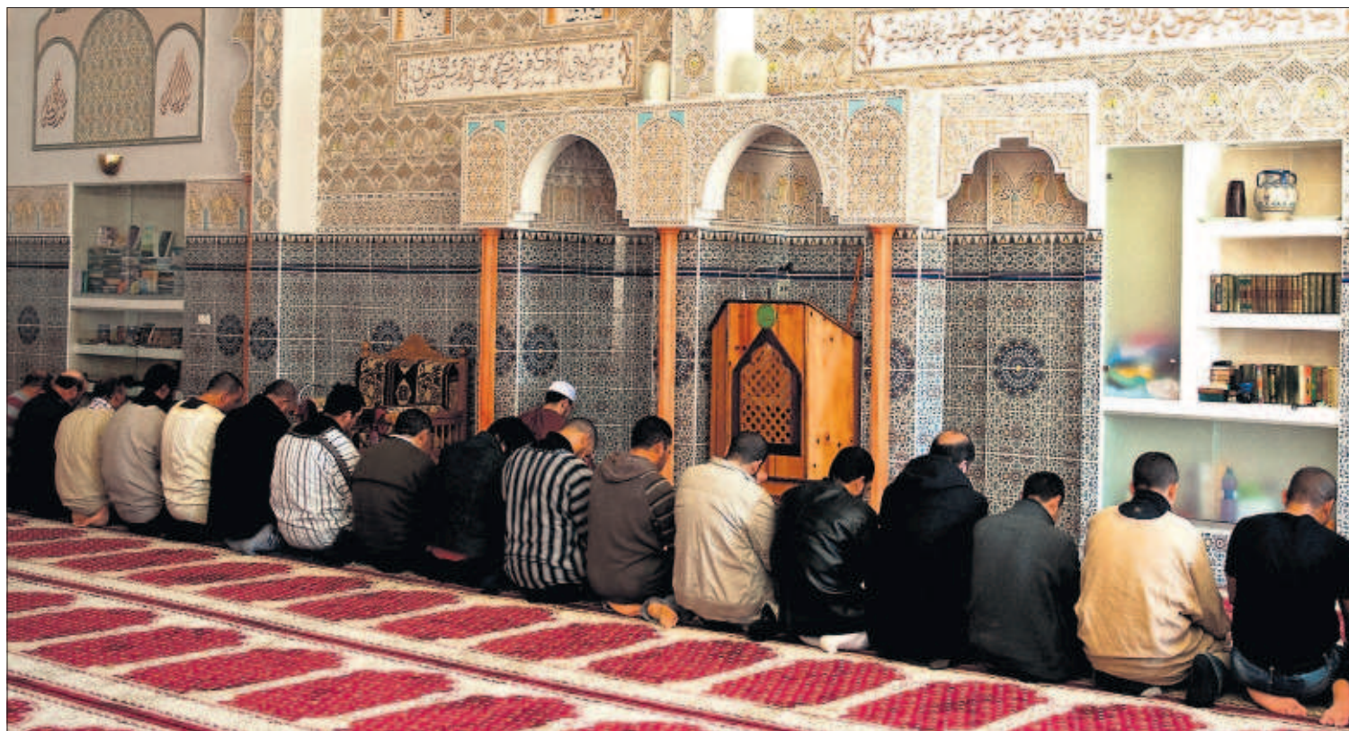
Alumnos del curso de retórica árabe para imanes de la Federación de Entidades Islámicas rezan en la mezquita de L'Alcúdia (Valencia).

La Generalitat ha dado un paso más en su proyecto para vender los datos de los pacientes de la sanidad pública. La comunidad ha encargado a la Agencia de Calidad y Evaluaciones Sanitarias de Cataluña que anonimice esa información antes de que la usen los centros de investigación o empresas privadas que los compren. La medida es objeto de gran polémica. PÁGINA 34