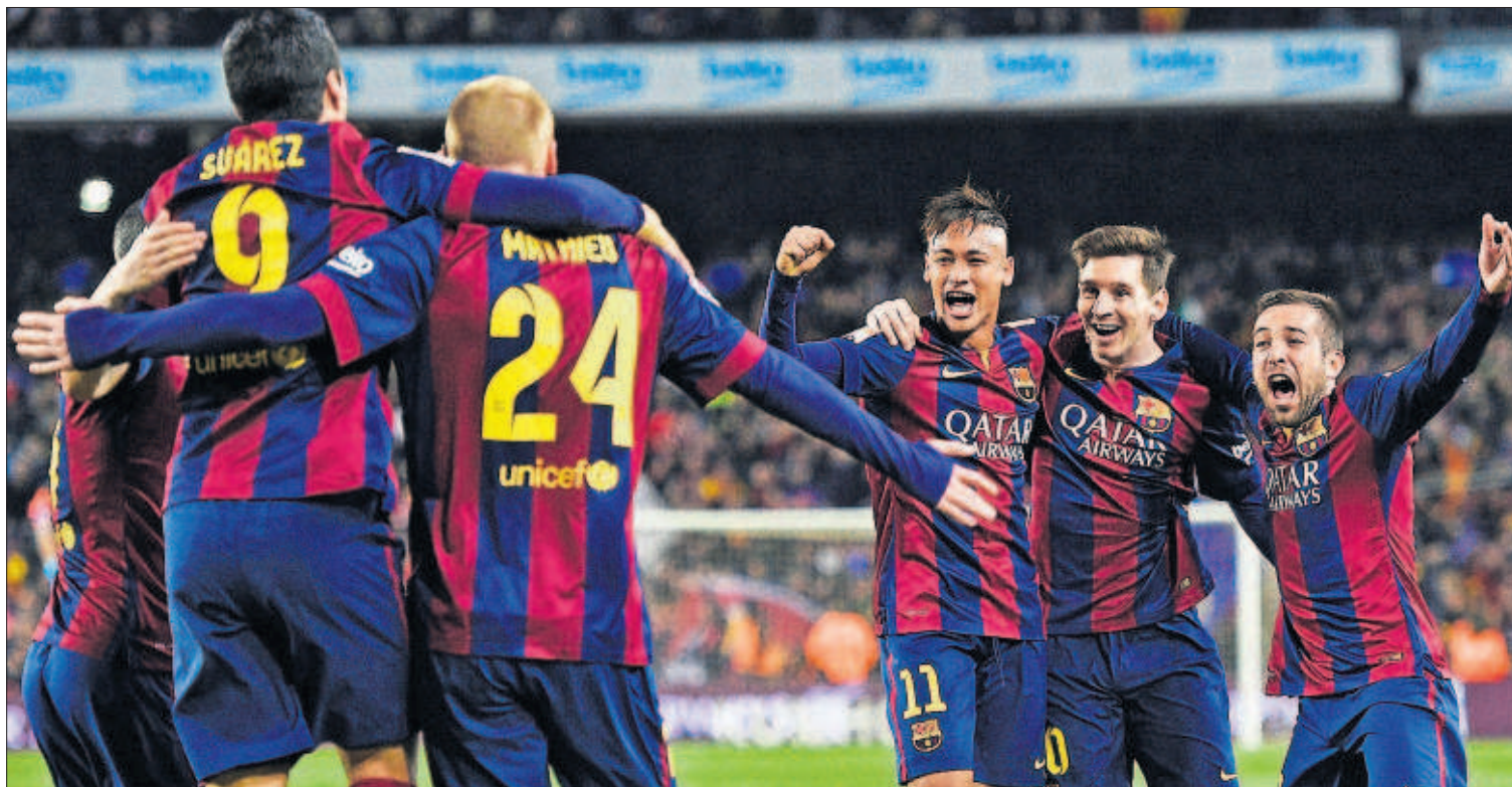
EL BARCELONA GANA (2-1) EL GRAN CLÁSICO AL MADRID. Con goles de Mathieu de cabeza y de Luis Suárez, el Barcelona ganó ayer el gran clásico del fútbol español al Real Madrid en el Camp Nou y se afianza como líder de la Liga con cuatro puntos de ventaja sobre su gran rival. Cristiano Ronaldo marcó para los blancos. En la imagen, los barcelonistas celebran el primer tanto del encuentro. PÁGINAS 31 A 33