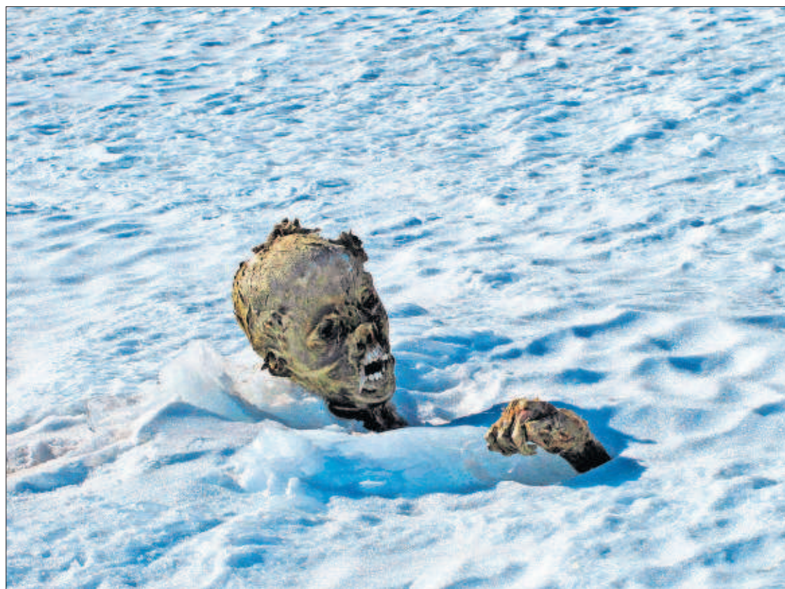
UN ABRAZO DE 56 AÑOS EN EL PICO MÁS ALTO DE MÉXICO. Un equipo de montañistas ha encontrado en el Pico de Orizaba los cadáveres momificados (uno en la imagen) de unos escaladores que desaparecieron en 1959. PÁGINA 41

permanente" de inspectores o vigilantes del pago del IVA reclutados entre "amas de casa, estudiantes e incluso turistas en las áreas donde más se defrauda". También se tomarán medidas para reducir la burocracia y fomentar el clima empresarial. PÁGINA 4