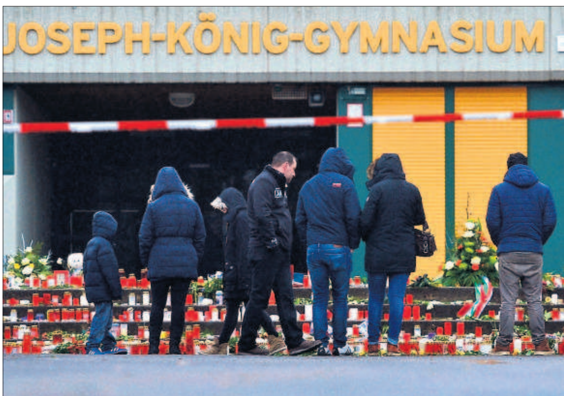
Velas depositadas en el instituto de Haltern am See (Alemania), en recuerdo de sus alumnos muertos.