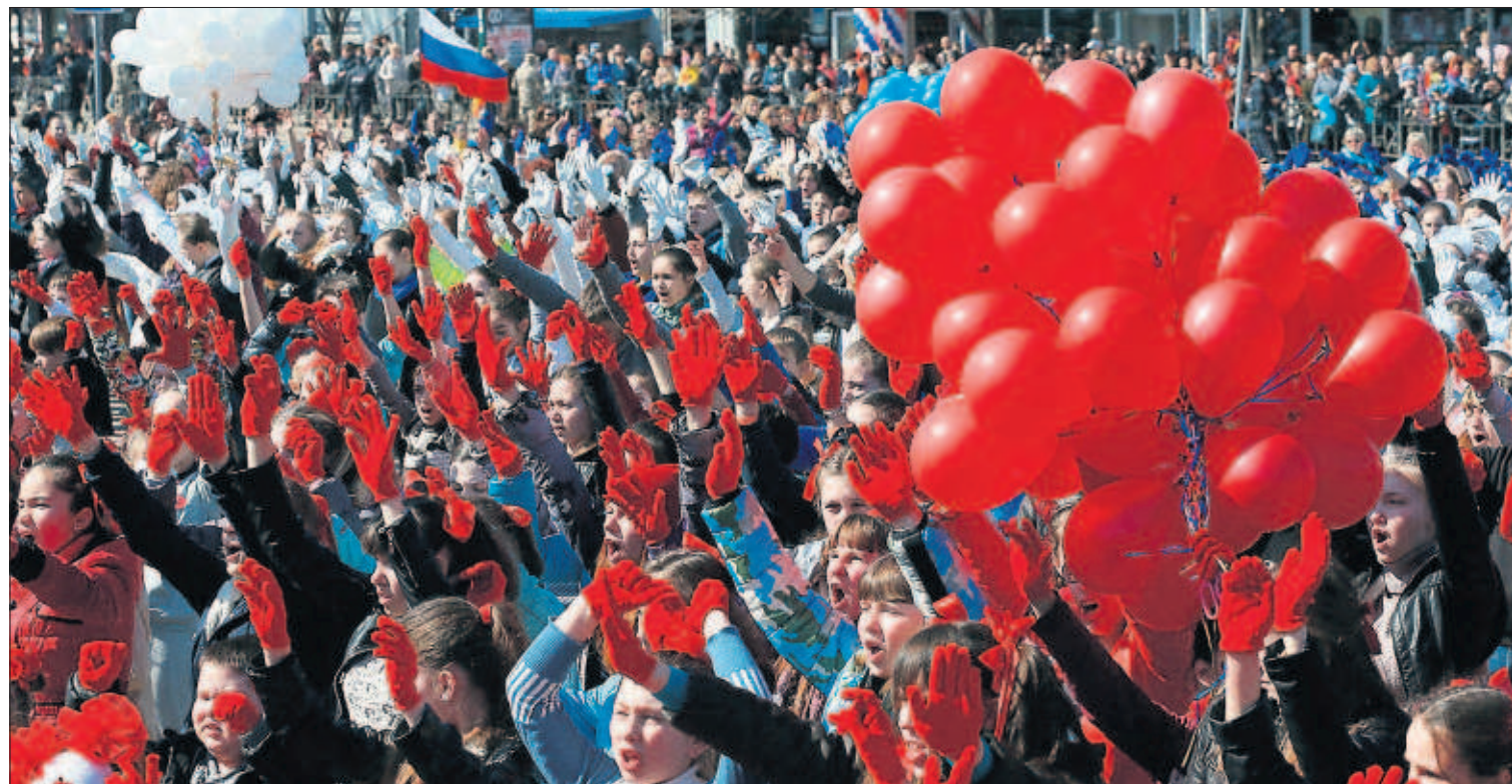
CRIMEA, UN AÑO DESPUÉS DE LA INVASIÓN. Simferópol, la capital crimea, celebra el primer aniversario de la anexión a Rusia pese a las dificultades de la transición: austeridad, aislamiento, inflación y unas autoridades que persiguen toda deslealtad. La amenaza de Moscú no ha terminado. “Rusia aún utiliza la fuerza en Ucrania”, asegura el secretario general de la OTAN, Jens Stoltenberg, en una entrevista con EL PAÍS. PÁGINAS 2 Y 3

La unidad contra el blanqueo de capitales ha enviado a la fiscalía 23 operaciones realizadas por políticos y empresarios desde Banco Madrid por indicios de delito. Se calcula que movieron 34 millones con la filial española del grupo andorrano BPA. PÁGINAS 32 Y 33