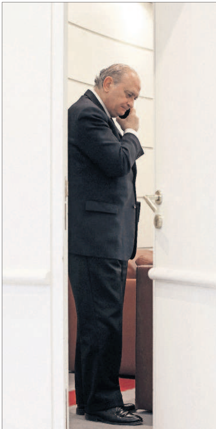
EL MINISTRO NO DA EXPLICACIONES. Jorge Fernández-Díaz ordenó ayer investigar los negocios de Villarejo, pero no dio explicaciones en una comparecencia en el Senado (en la imagen, antes de la sesión).