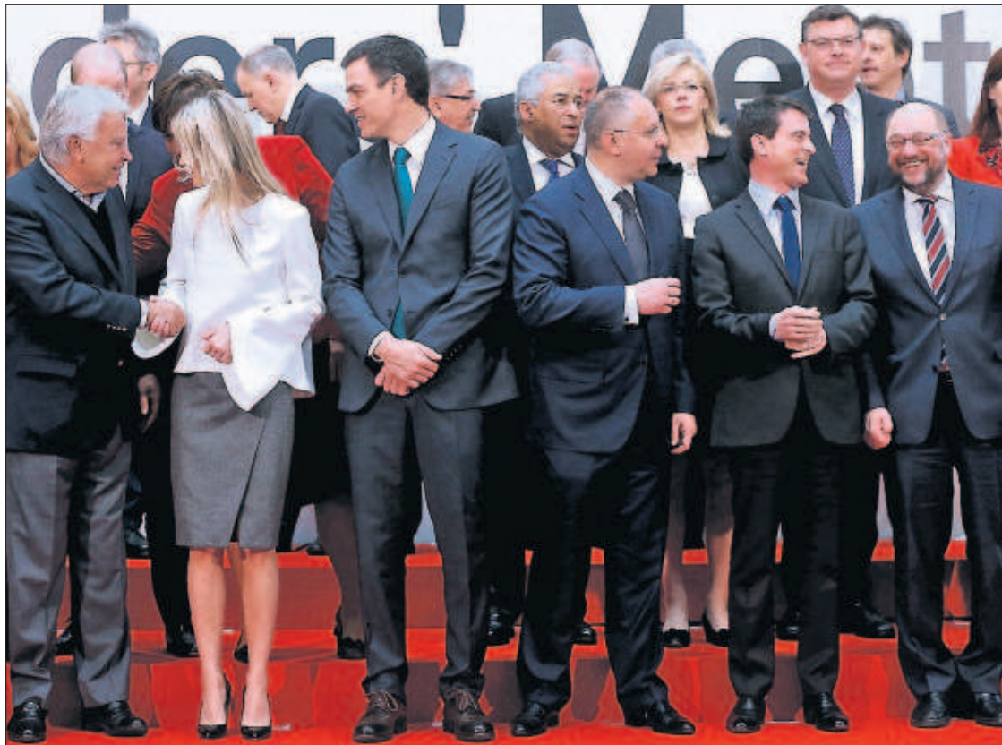
FOTO DE FAMILIA DE LA SOCIALDEMOCRACIA EUROPEA. Los líderes socialistas posan ayer en Madrid. En primera fila, de izquierda a derecha, Felipe González, Magdalena Ogórek (Polonia), Pedro Sánchez, Sergéi Stánishev (Bulgaria), Manuel Valls (Francia) y Martin Schulz (Alemania).