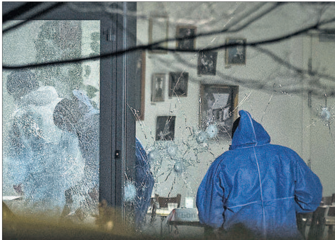
Policías forenses en el centro cultural de Copenhague, donde se produjo el atentado.

En vísperas de su visita a Madrid, Federica Mogherini, jefa de la diplomacia europea, se muestra esperanzada con el acuerdo entre Rusia y Ucrania. Si no, declara a EL PAÍS, están las sanciones. Lo que no hay es salida militar. PÁGINA 4