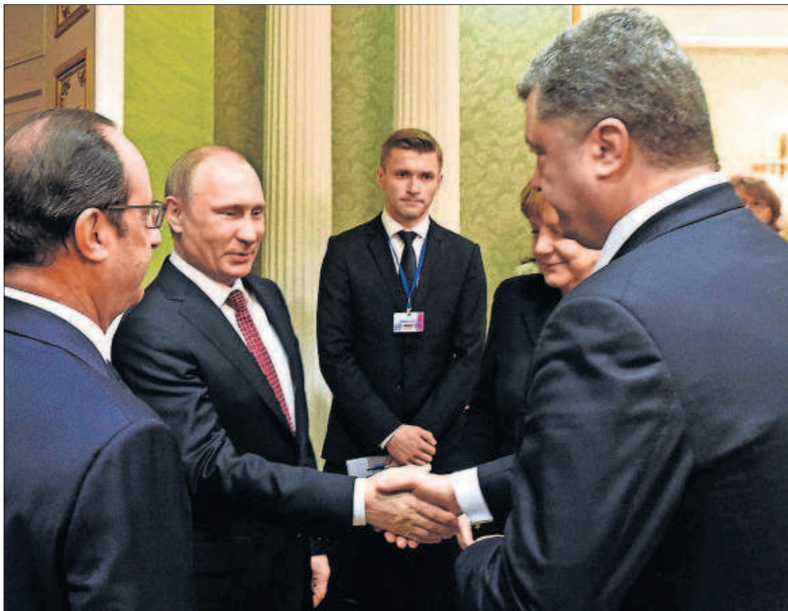
Putin y Poroshenko se saludan ante Hollande y Merkel, antes de su encuentro en Minsk.

Los líderes de Alemania, Angela Merkel, y de Francia, François Hollande, se reunieron anoche en Minsk con los presidentes de Ucrania y Rusia con el propósito de forjar un acuerdo de alto el fuego para pacificar el este de Ucrania y atajar el conflicto que ha costado ya más de 5.200 muertos. La guerra en el patio trasero de Europa entre las fuerzas leales a Kiev y los prorrusos apoyados por Moscú continuó segando vidas ayer. PÁGINAS 2 Y 3