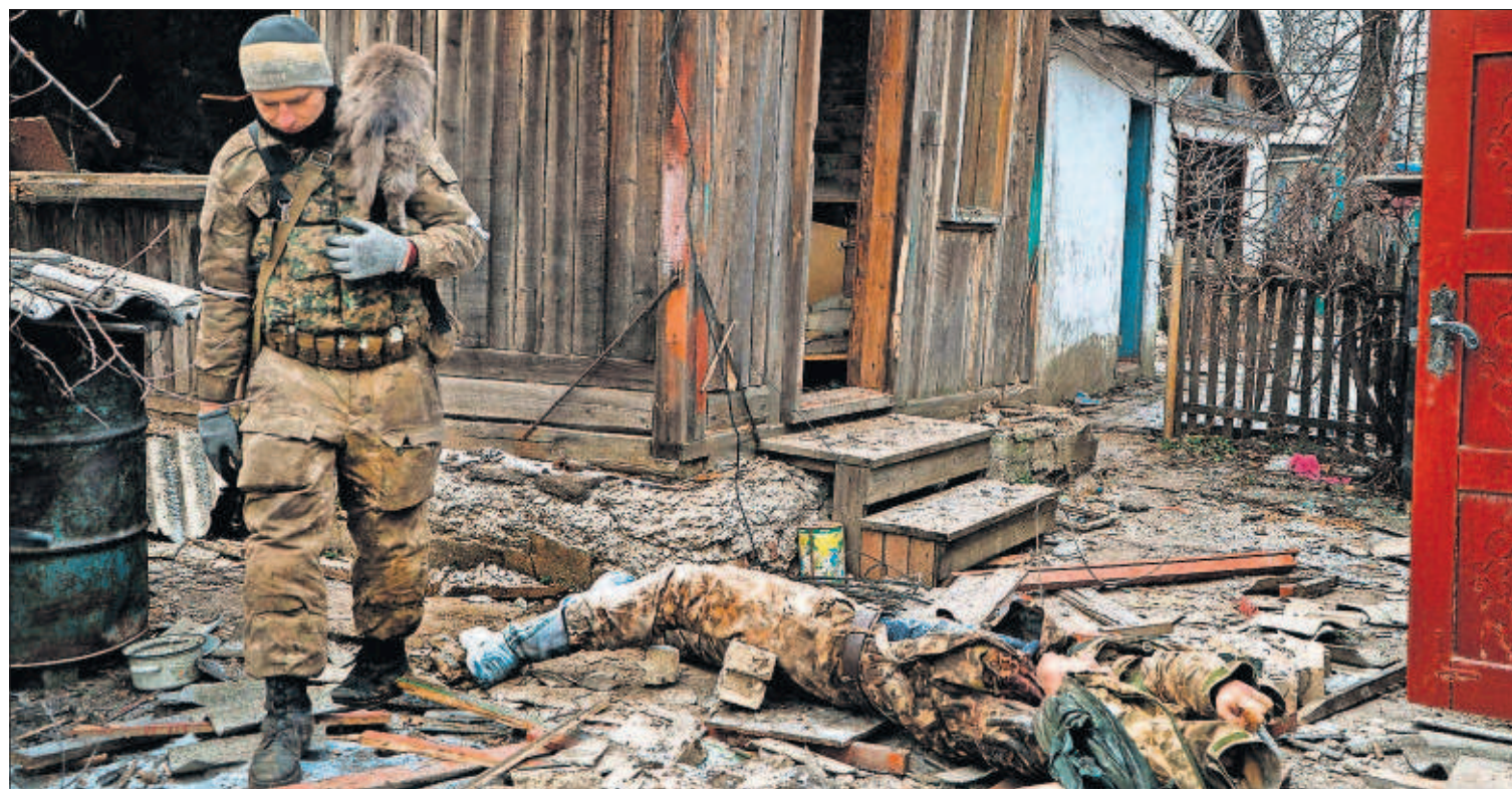
Un rebelde prorruso pasa ayer junto a un soldado ucranio muerto en la ciudad oriental de Vugleirsk en la provincia de Donetsk.

Entrevista con un mito del cine que ha dejado una huella indeleble en su país Por Marc Bassets