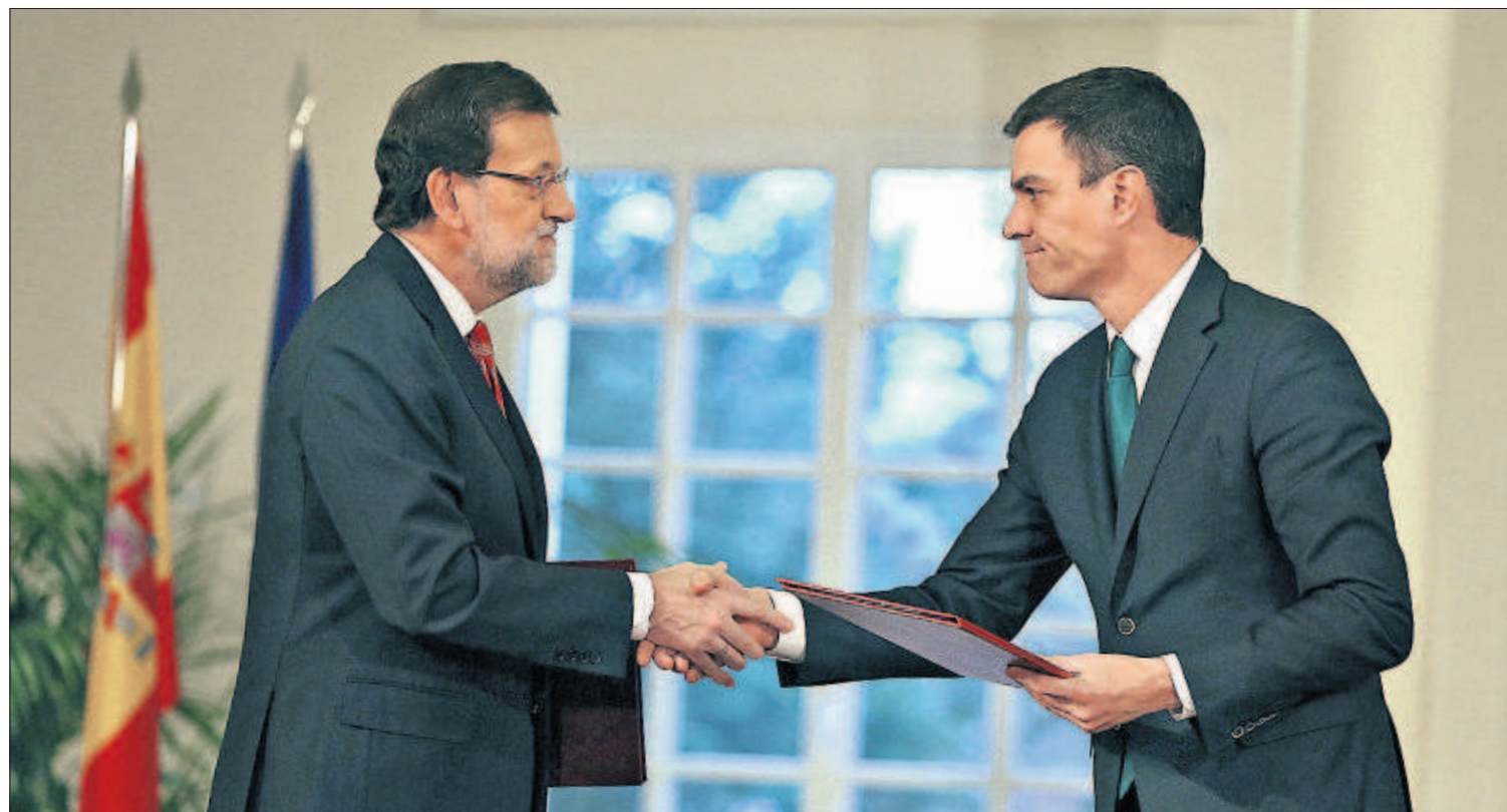
El presidente Mariano Rajoy y el líder del PSOE, Pedro Sánchez, durante la firma de su primer pacto de Estado ayer en La Moncloa.

Los rebeldes de Donetsk, en el este de Ucrania, se preparan para movilizar hasta 100.000 soldados contra el Ejército de Kiev. La movilización general de los separatistas se produce en pleno recrudecimiento de los combates y tras el fracaso diplomático para pactar un alto el fuego. El Gobierno central ha convocado también a sus reclutas. PÁGINAS 2 Y 3