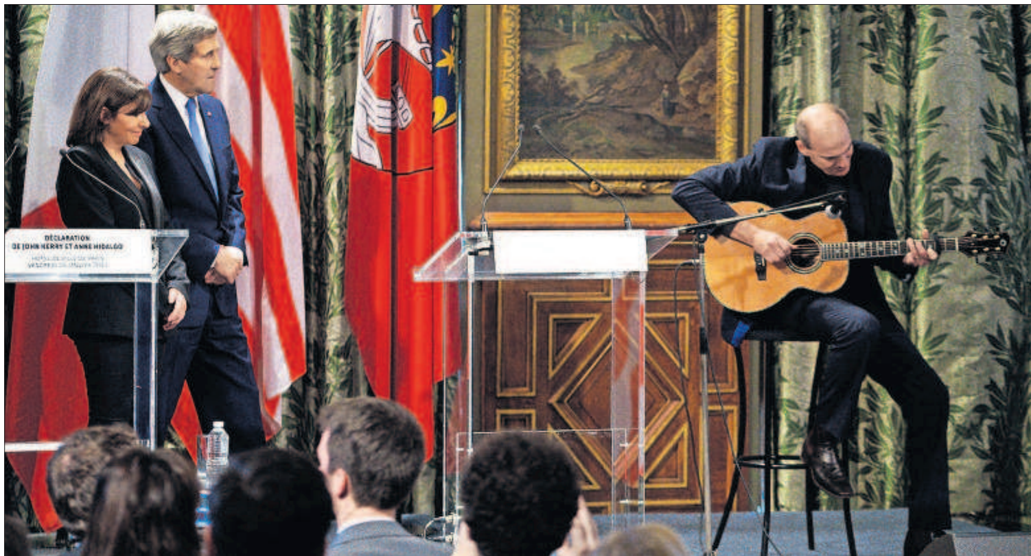
FRANCIA Y ESTADOS UNIDOS, DOS AMIGOS CONTRA EL TERROR. El secretario de Estado estadounidense, John Kerry, destacó ayer la "lección al mundo" que Francia ha dado tras los atentados de la semana pasada. Después de reunirse con el presidente François Hollande, Kerry visitó a la alcaldesa de París, Anne Hidalgo. En el Ayuntamiento estuvieron acompañados por el músico James Taylor, autor de You got a friend.

Estados Unidos y Reino Unido anunciaron ayer la puesta en marcha de un inédito programa conjunto de ejercicios de ciberguerra. Ante la creciente amenaza de ataques informáticos, los dos países formarán cibercélulas mixtas con especialistas de sus servicios secretos. Los objetivos del simulacro serán los sectores financieros. PÁGINA 6