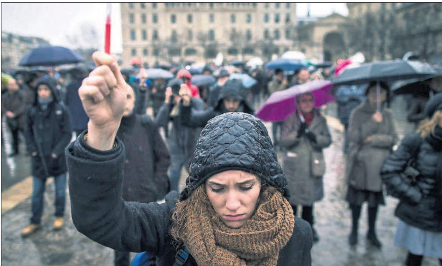
Una mujer alza ayer en París un lápiz en símbolo de protesta por el asesinato de dibujantes y periodistas durante un minuto de silencio por la matanza.