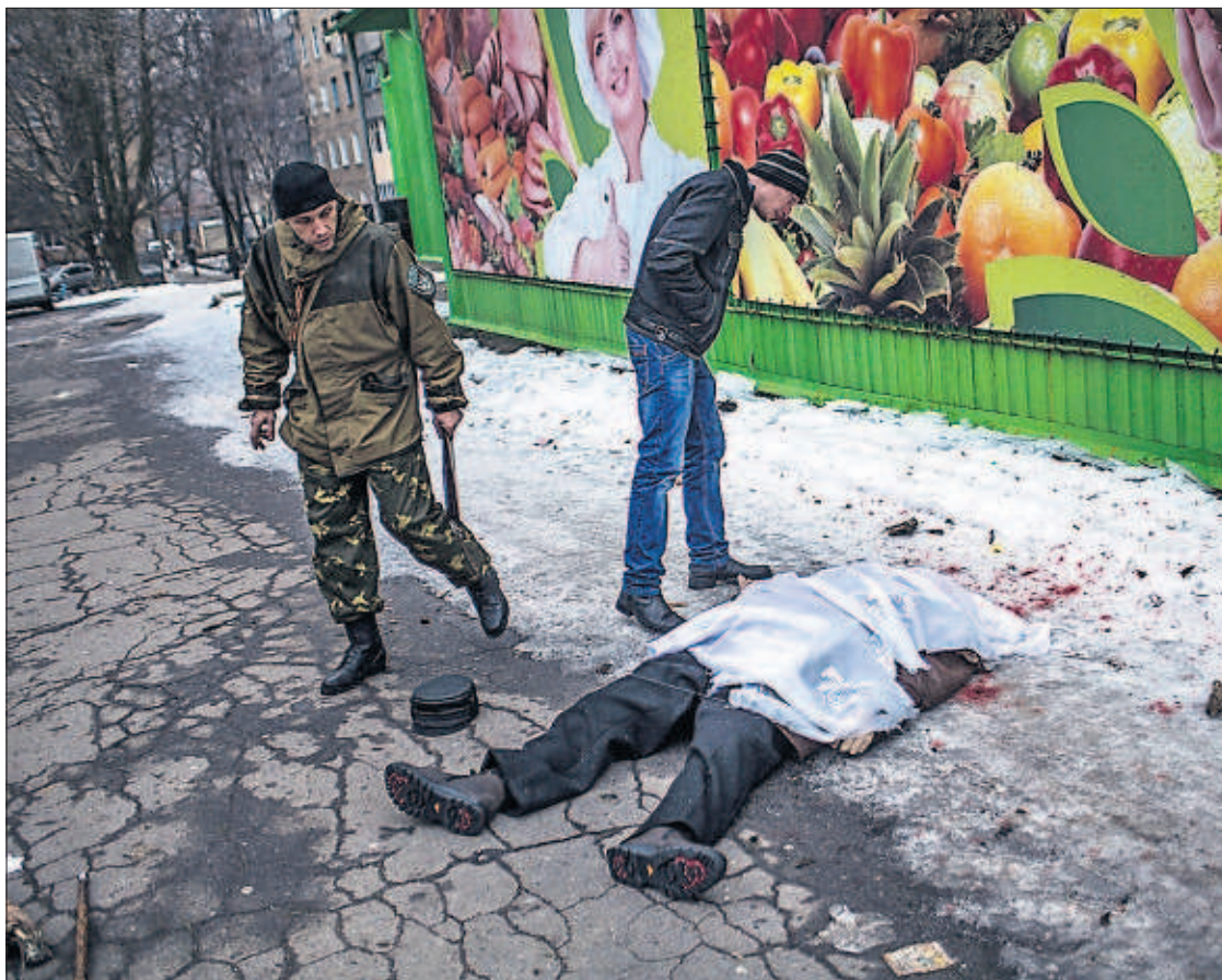
EL GOBIERNO DE KIEV RECLAMA UNA TREGUA URGENTE. El presidente de Ucrania, Petró Poroshenko, pidió ayer la negociación de una tregua con los secesionistas prorrusos, después de la reciente escalada del conflicto. En la imagen, un separatista pasa junto a una víctima de un bombardeo en la ciudad de Donetsk.

La recuperación de la confianza de los consumidores en los últimos meses del año permitió a las tiendas cerrar 2014 con un avance del 0,9%, el primer dato positivo desde la llegada de la crisis en 2007. La última campaña navideña fue la mejor en más de una década, con una subida de las ventas del 6,5%. PÁGINA 25