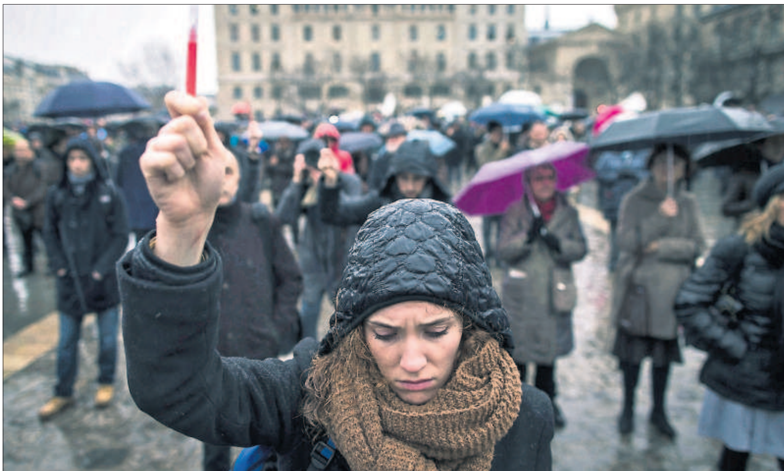
Una mujer alza ayer en París un lápiz en símbolo de protesta por el asesinato de dibujantes y periodistas durante un minuto de silencio por la matanza.