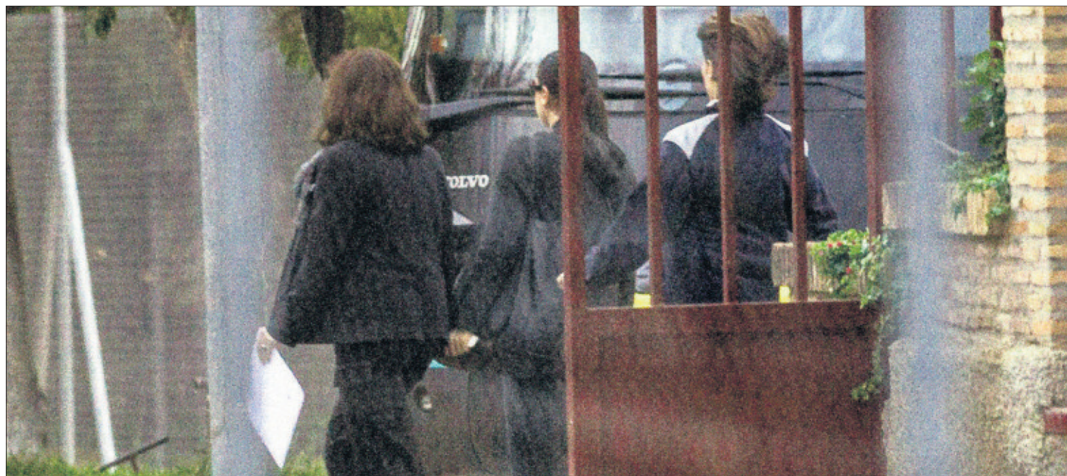
RAFA ALCAIDE (EFE)